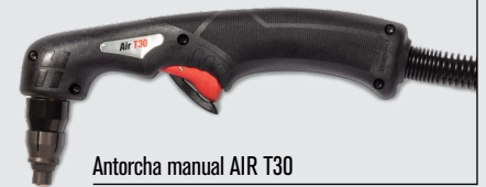
Antorcha manual AIR T30