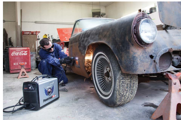
Reparación y modificación de vehículos